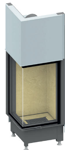
Ekko 45(45)80 mit hochschiebbarer Front