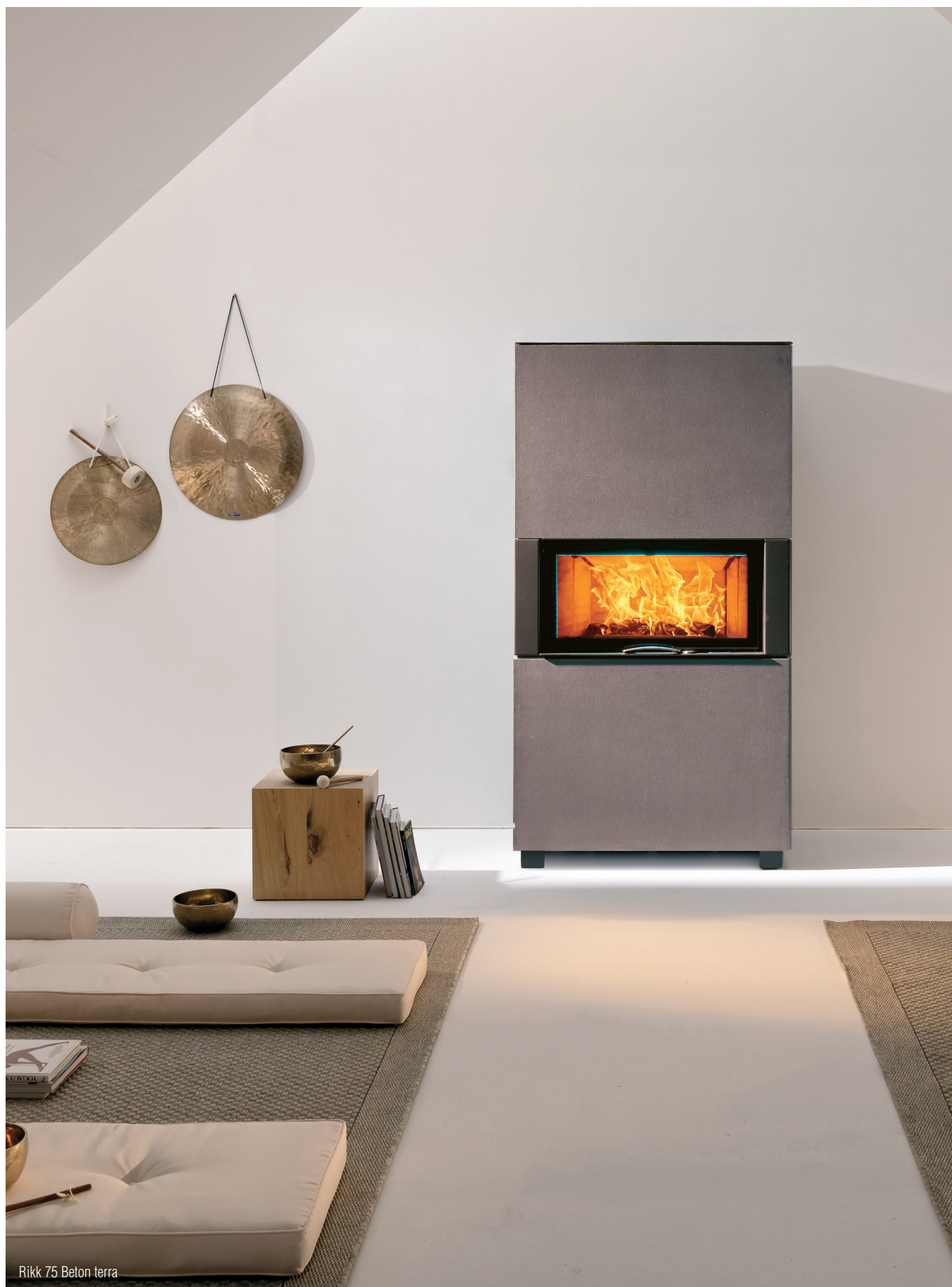
Rikk 75 Beton terra